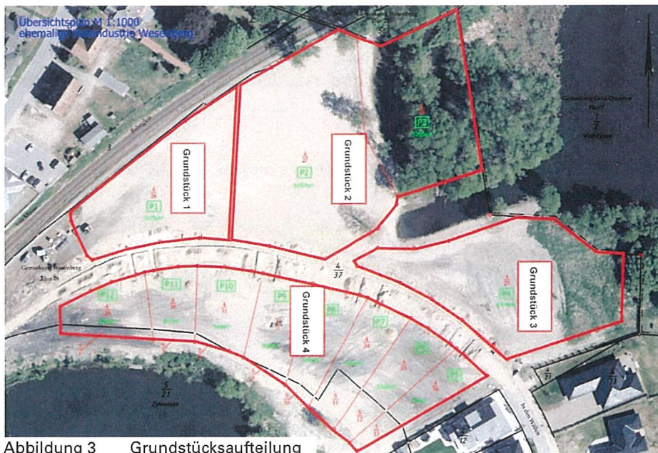
Abbildung 3 Grundstücksaufteilung