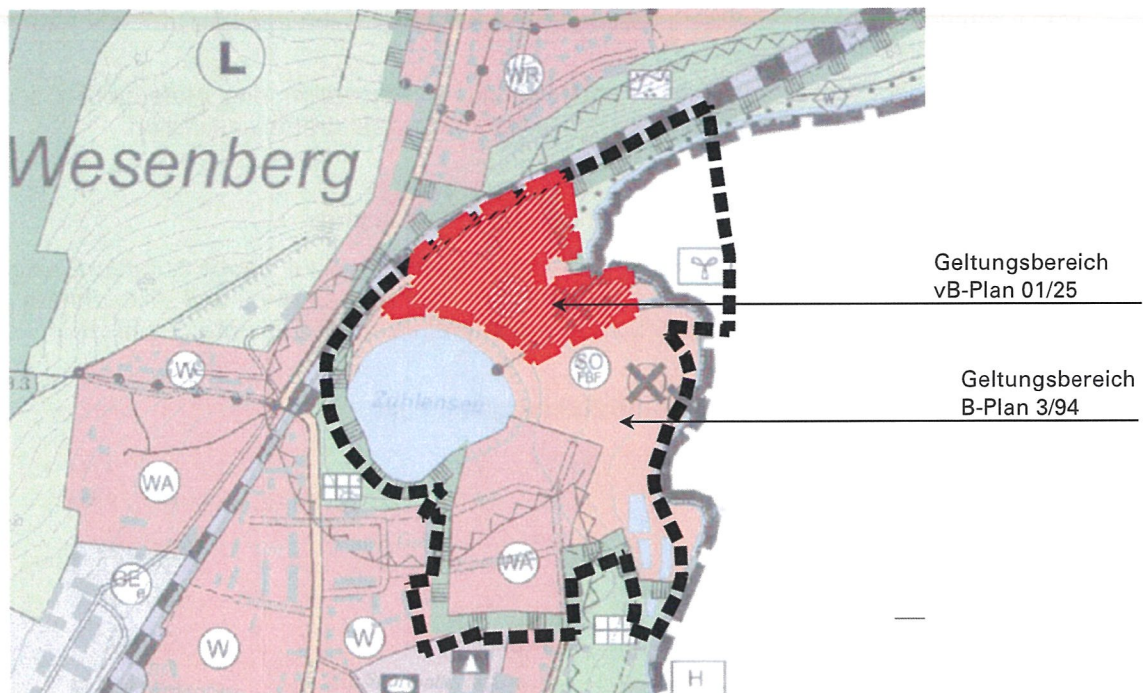
Abbildung 2 Lage des Geltungsbereiches innerhalb des Flächennutzungsplanes

Der Flächennutzungsplan ist Grundlage des Entwicklungsgebotes und wird redaktionell nach Satzungsbeschluss dieses Verfahrens angepasst. Der Geltungsbereich ist im Flächennutzungsplan ist mit SO WZ (Wassersportzentrum) definiert. Dies sollte gemäß Stellungnahme des Landkreises vom 05.09.2024 unverzüglich nach Satzungsbeschluss geschehen